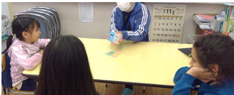
イラストを見て、好きな理由を話す練習をしています。