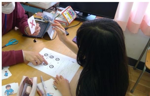
ものごと たの ぶんげい ねんしゅう 物事を頼む文型の練習をしています。