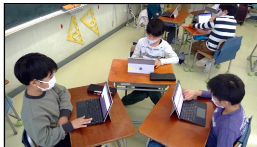
タブレット端末を活用して、グループで活動している様子

発表の前に、学級でリハーサルを行いました。声やスクリーンの文字の大きさなどの基本的なこと以外にも、「1年生に漢字を使ったら読めないと思うので、振り仮名をつけた方がよいです。」という意見や、「クイズなどを入れると、楽しんでもらえるから、もう少し工夫したらよいと思います。」など、下級生のことを考えた発言も多くありました。4年生へ向けて、成長している姿を感じるとともに、とても頼もしく感じました。発表では、とても緊張していましたが、練習の成果を生かし、一生懸命取り組むことができました。3年生の子供たちに聞いてみると、楽しく取り組めたという感想が多かったです。