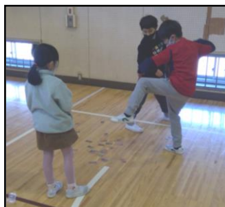
1年生と一緒に遊んでいる様子