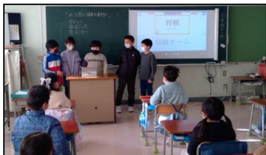
2年生へ発表している様子