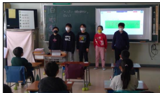
1年生へ発表している様子