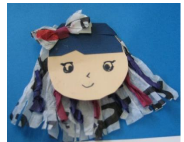
フライングリボンヘア