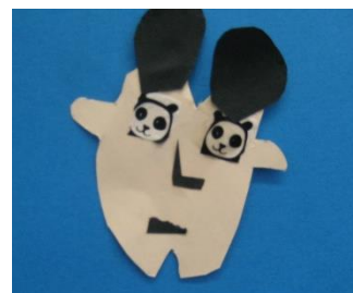
ミッキーマウスヘア