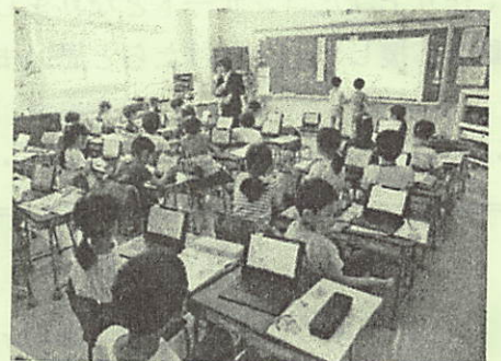
タブレットを使った授業

5・6年生では英語が教科となり週2時間行われます。教科書が用いられ成績も付くこととなります。また、プログラミング学習も導入されます。そのため、教員によって英語とコンピュータの指導力に差があることが課題になっています。国語や算数など他の教科よりも指導に得意不得意の差があります。本校では、教員の英語の指導力とコンピュータの活用能力を高めるために、あえてこのテーマにしました。英語もプログラミングもまだ入口の段階ですが、令和2年度の全国発表を目指し、さらに研修や研究を進めてまいります。