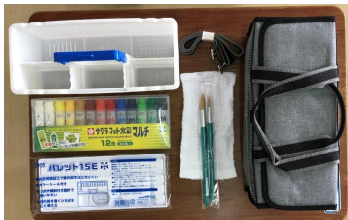
・絵具セット (R2年度見本)