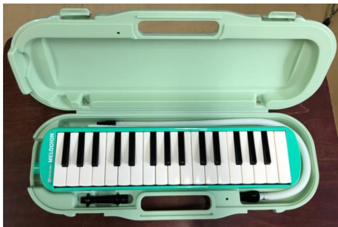
・鍵盤ハーモニカ (R2年度見本)