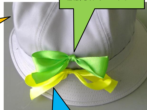
放課後クラブ リボン