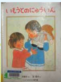
「いもうとのゆういん」

たくさんあるのですが、この2冊はどちらも小さな子供が一生懸命がんばるお話で、大好きです。勇気をもらえ、元気が出ます。