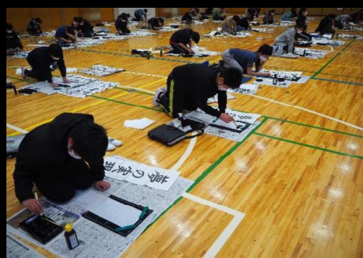
ピッカピカ床の広い体育館