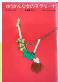
「ゆうかんな女の子ラモーナ」