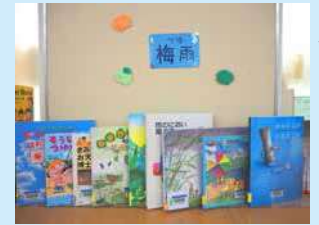
梅雨の季節に合わせた特集コーナー