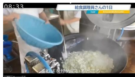
給食委員会作成動画「モーニング笹塚」

タブレットにより広がる子供たちの未来、可能性の大きさに、大いなる期待と確かな手応えを感じています。