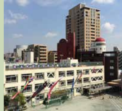
毎年掲げる鯉のぼりと校舎