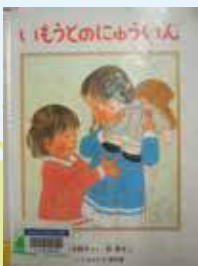
「いもうとのにゅういん」

たくさんあるのですが、この2冊はどちらも小さな子供が一生懸命がんばるお話で、大好きです。勇気をもらえ、元気が出ます。