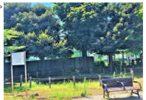
猿楽古代住居跡公園