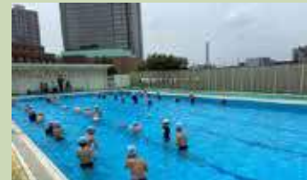
屋上プール（奥に見えるのがガーデンプレイス）

3階建ての校舎の屋上に25mプールがあります。ガーデンプレイスが望める展望は大変素晴らしく、夏休み中のプール開放はちょっとした人気なのですが、高い位置にあるため風が強く寒いと、児童の評判は今一つ？のようです。災害時には、水を供給する設備も設けられています。