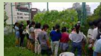
かけづかファーム

敷地の一角に、授業等に活用される農園が設けられています。地域コーディネーターさんの協力で、令和3年にリニューアルされました。これまで、ジャガイモやキャベツ等を育て、理科の授業に利用されています。今年の夏にはヘチマを育て、その育成を観察しています。加計塚はデジタル教育が進んでいますが、自然体験もバッチリです。また、コンポストを設置し、給食の残渣を堆肥化する実証実験を行っています。