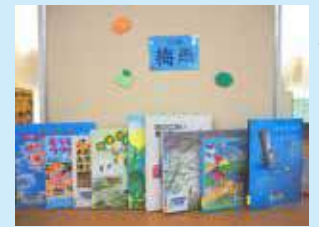
梅雨の季節に合わせた特集コーナー