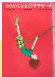
「ゆうかんな女の子ラモーナ」