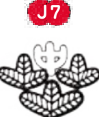
J7 松濤中学校 1949年創立