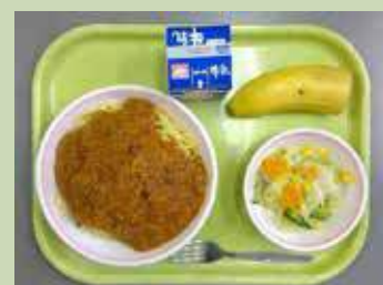
給食の王道 スパゲティミートソース （すいません、給食室の写真がありませんでした・・・）

加計塚小学校の給食は、校内にある給食室で作られています。コロナ禍の影響で、毎年行っていた試食会が実施されていないため、筆者自ら頂いたことはないのですが、「加計塚の給食はおいしい」ともっぴらの評判です。給食室のみなさま、毎日ありがとうございます。