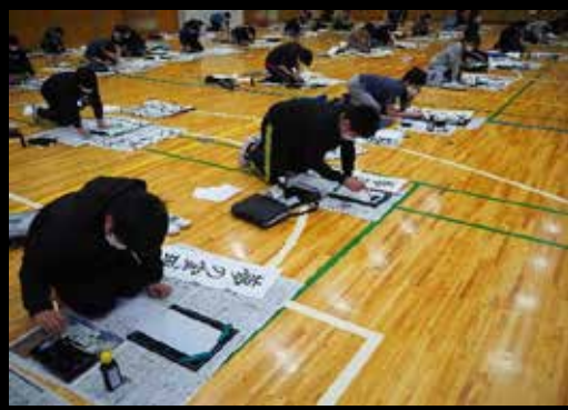
ピッカピカ床の広い体育館