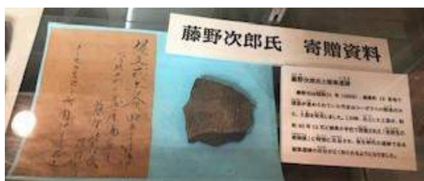
猿楽資料室に展示されている「寄贈された土器」

猿楽資料室には小学校と地域や金山小学校との交流そして古代遺跡の土器まで、思い出や歴史がたくさんつまっていて、これからも増え続けていくことでしょう。