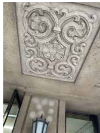
（校舎入り口天井の意匠）