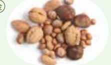
『木の実をたべてみよう』