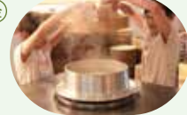
【かまど】かまどめしの日