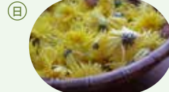
【旧暦】重陽 (旧暦9月9日) 菊の着せ綿