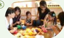
『みんなで「あみもの」を楽しもう』