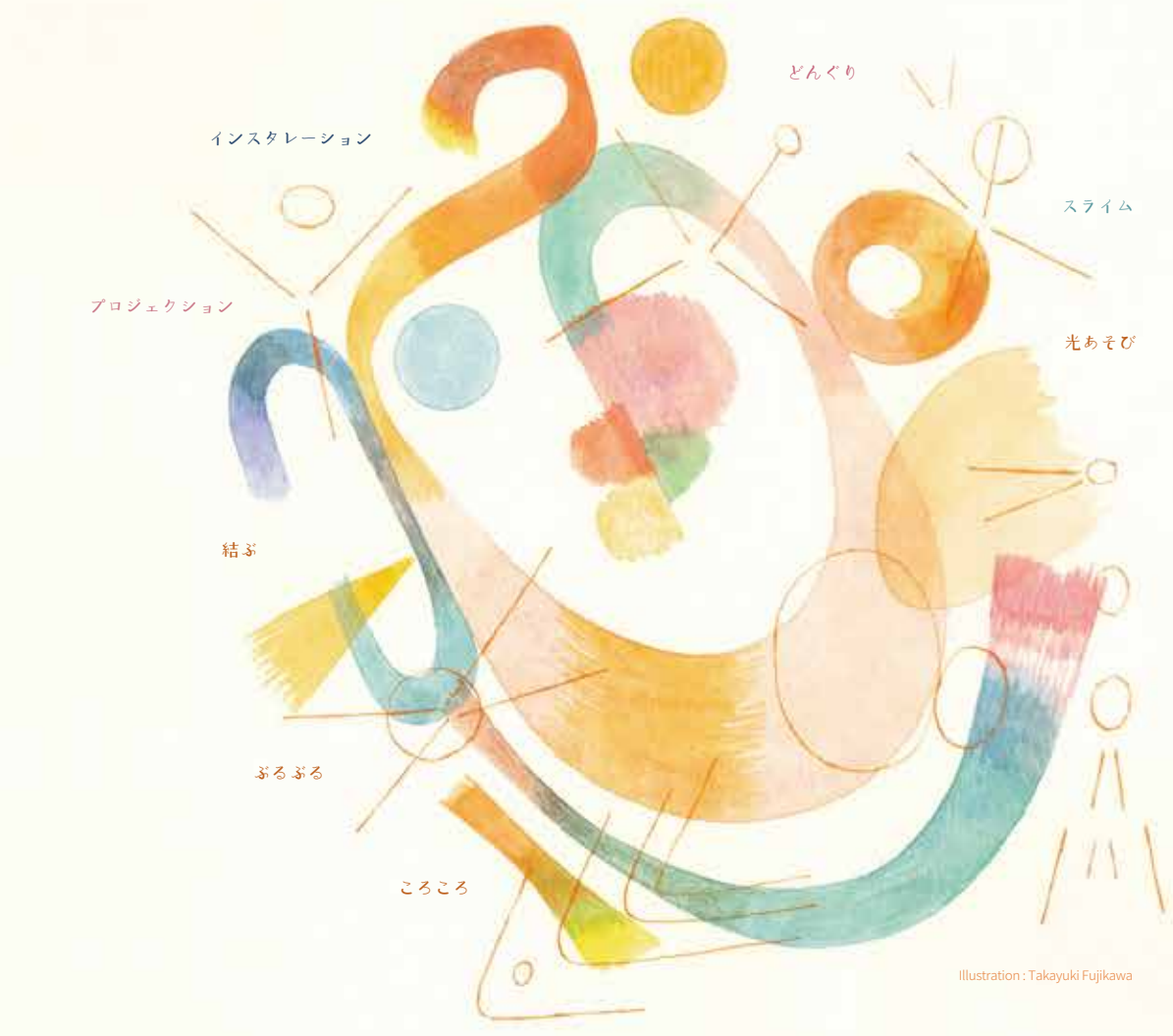
Illustration: Takayuki Fujikawa