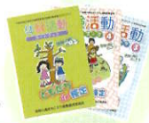
体験活動ガイドブック