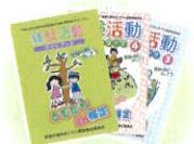
体験活動ガイドブック