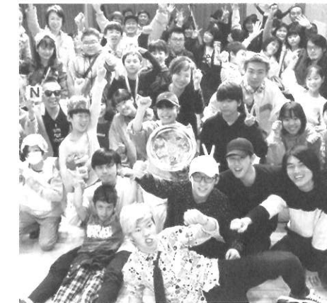
▲過去のコンテストの様子

また、12/1 (水) より「ティーンズ・クリエイター・オブ・ザ・イヤー 2022」を決めるコンテストのエントリーが始まりますので、そちらのご応募もお待ちしております。詳細・エントリーについては以下のQRコードからご確認ください。