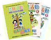
体験活動ガイドブック