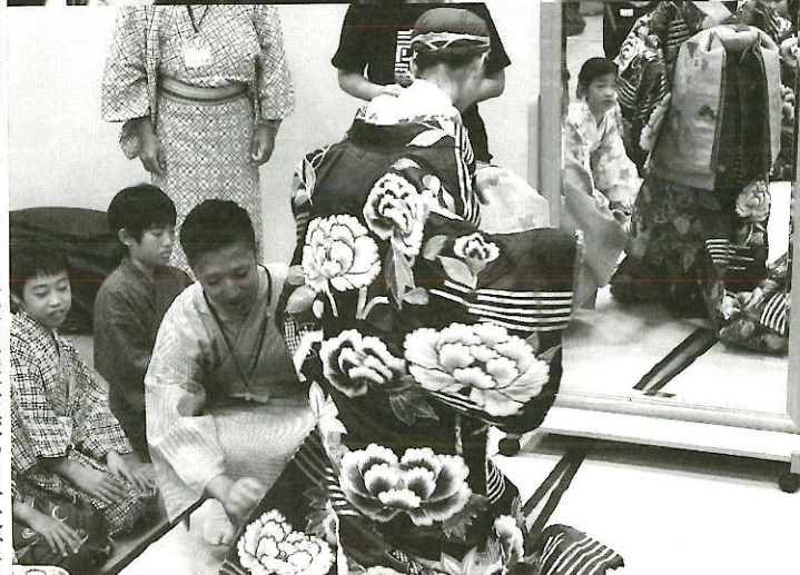
写真は過去の体験教室より。2021年度は内容が変わる予定です。