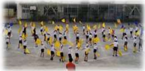
22日(木)の練習風景です

先日の稲刈りは天気が心配されましたが、無事に全行程を終えることができました。当日まで「本当に行けるの？」と気もそぞろだったかと思います。保護者の皆様、持ち物やお弁当の準備等、ありがとうございました。また、お忙しい中をボランティアとしてお手伝いいただきました皆様、誠にありがとうございました。食を支える農家の方々の苦勞を体験するとともに、収穫の喜びを味わうことができました。事後の学習では、「手作業での稲刈りは本当に大変で、農家の方々の苦勞がよくわかった。」「機械化の恩恵をいやというほど実感しました。」等、様々な声が聞こえてきました。コロナ禍において子供たちの学びや体験が制限される中、貴重な体験となりました。