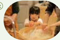
【かまど】かまどめしの日