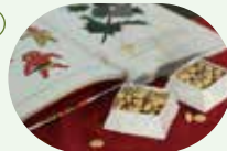
『節分の豆をつくろう』