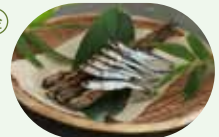
『いろいろ』うるめいわしを焼こう