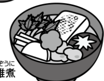
かんとうふうぞうに関東風雑煮