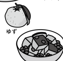
かぼちゃと小豆のいとこ煮