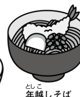
としこ年越しそば