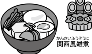
かんざいふうぞうに関西風雑煮

地域の食材を使った、もち入りの汁物。主に西日本では丸もち、東日本では角もちが用いられます。あん入りのもちを入れる所、もちを入れない所もあります。