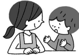
悩みがあるとき 相談できる