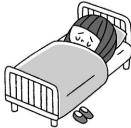
具合が悪いとき 一時的に休養できる