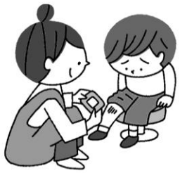
ケガをしたとき 救急処置してもらえる