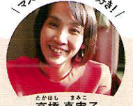
「マスを集めるのが好き！」 高橋 真実子 (アナウンサー)