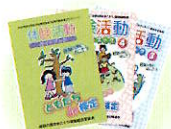
体験活動ガイドブック