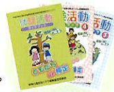
体験活動ガイドブック