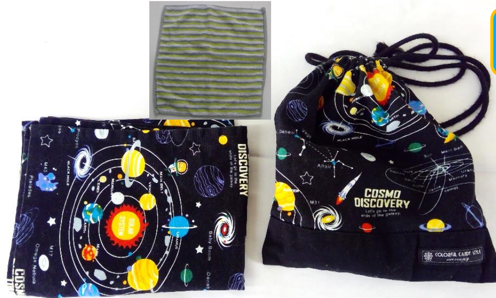
ランチヨンマット

食事の時にランチヨンマットを机に敷きます。机の大きさは、縦40センチ、横60センチです。袋は小さいもので大丈夫です。毎日、洗濯を済ませたものを持たせてください。