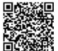
整備方針の内容 (区ホームページ)