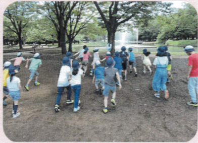
代々木公園での全校遠足。たてわり班で楽しく遊びました