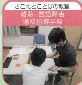
きこえとことばの教室 難聴・言語障害 通級指導学級