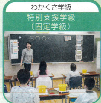
わかさ学級 特別支援学級 (固定学級)

通常学級・わかさ学級(特別支援学級)と、2つの通級指導学級「きこえとことばの教室(聴覚言語学級)」・「ふたば学級(情緒障害等、特別支援教室〈拠点校〉)」があります。それぞれの専門性をもって、個に応じた支援を行っています。