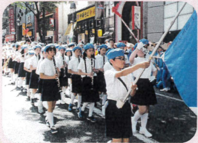
運動会や区民の広場パレードで、堂々とした行進や演奏を披露