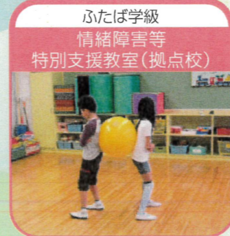
ふたば学級 情緒障害等 特別支援教室(拠点校)