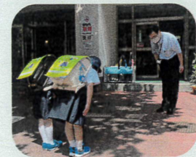
いつも子供たちの安全を見守っています