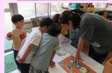
オタマジャクシどうなったかな？