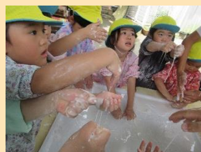
片栗粉がトロトロになった！ きもちいい！