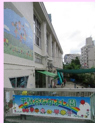
芝生の広い校庭庭