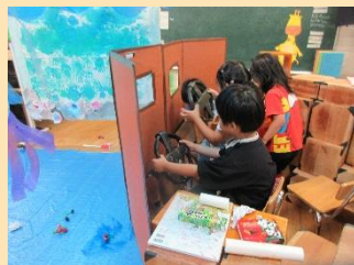
潜水艦に乗って、海の冒険にでかけよう！