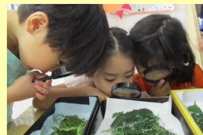
～蚕の飼育～小さな命の成長を見守る中で、子供たちは毎日心躍る体験を重ねています。