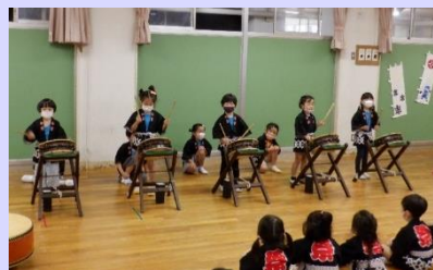
広尾幼稚園伝統の「そら組太鼓」