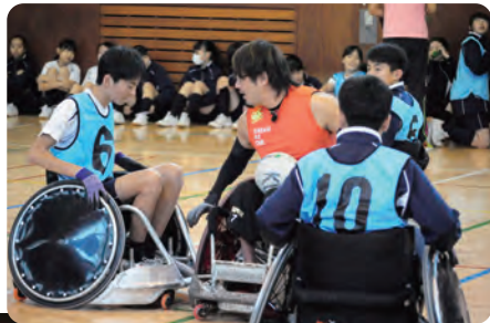
「ウィルチェアラグビー」 日本代表選手との交流授業 (オリンピック・パラリンピック 教育推進事業)