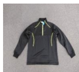
①背中下記プリント有