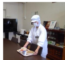
給食室 校長室に配膳してくれました