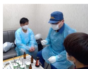
渋谷警察署・鑑識体験