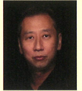
● スチールカメラ ZIGEN