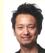
● ヘアメイク 原田忠