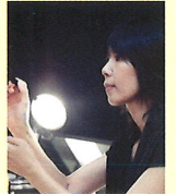
● ヘアメイク 鈴木節子