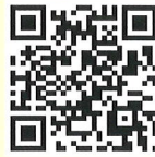
「こどもファッションプロジェクト」 公式サイト

※応募者多数の場合は、課題提出による選考となります(コースにより異なります)。 ※お預かりした個人情報は本事業の実施及び主催者からのご案内のみに使用し、適切に管理します。 ※やむを得ない理由によりプログラム内容に変更が生じる場合がございます。