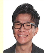
● 動画撮影 桑野徹