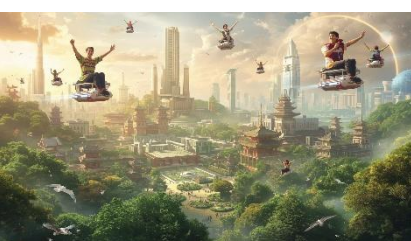
自由に空を飛べる