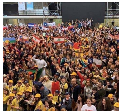
【DFC国際大会の様子・2019年ローマ】