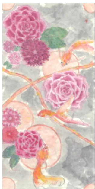
夜に泳ぐ 花と金魚