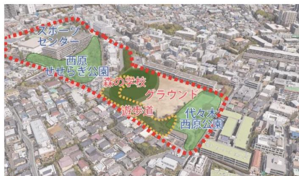
図VI-1-3 遊歩道で緑をつなぐイメージ

https://files.city.shibuya.tokyo.jp/assets/12995aba8b194961be709ba879857f70/a0abde5e95d140489cb0f73f94313234/yoyogi_keikaku.pdf