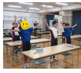
↑後出しじゃんけん 反射神経を鍛えます👊