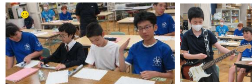
うた ひと き ひと こころ あた 歌う人・聴く人の心を温かくする やさしいメロディーと希望に満ちあふれた 歌詞が魅力的な曲です👍

いぜん がっしょうれんしゅう ゆめ せかい 以前から合唱練習をしてきた「夢の世界を」のサビをキーボード・トーンチャイム・ がっそう こんかい はじ ちょうせん せんせい よそう ギターで合奏しました🎹🎸 今回が初めての挑戦でしたが、先生たちの予想を おお うわまわ かんせいど し あ 大きく上回る完成度に仕上げることができました😊