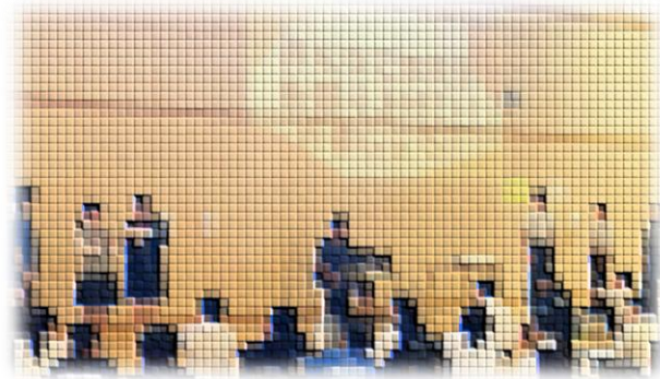
↑体育祭実行委員、準備がとても丁寧でした。休日にも Teams を活用して活動している様子があって感心しています。当日は6人で分担して全体に説明をしていました。

下記時間割のとおり、来週より体育祭の練習が始まっていきます。2年生の皆さん、勝ち負けがついてしまうものですが、それ以上の価値を見出せる活動となるように真剣に臨んでいきましょう！