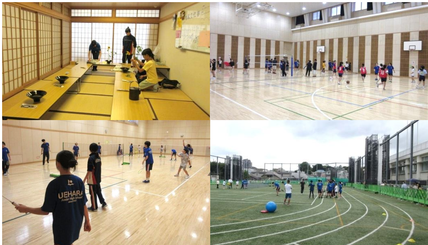
部活動体験の様子