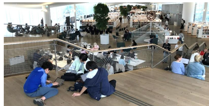
図書館で探究学習

今後もシリコンバレー派遣研修とフィンランド派遣研修は続きます。どちらも貴重な体験になります。積極的に派遣を目指してほしいと思います。もうすぐ来年度の募集が始まります。