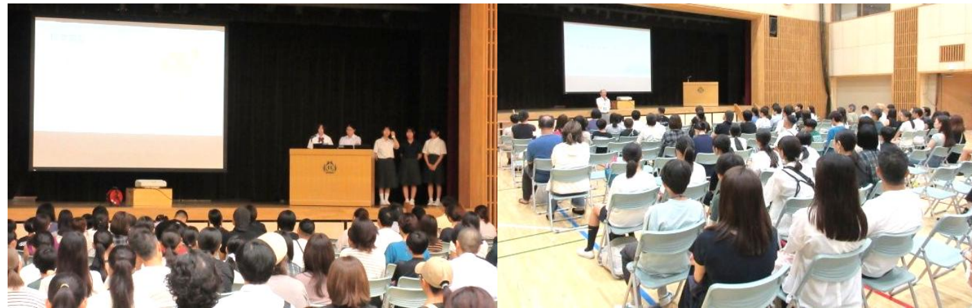
学校説明会の様子

9月8日（月）から13日（土）の間、第2回学校公開週間が行われ、多くの保護者や地域の方が授業を参観しました。9月13日（土）は1、2校時の授業後、学校説明会を行いました。200名以上の多くの児童と保護者の方が参加しました。生徒会役員が学校紹介を行い、学校生活の様子を詳しく伝えました。質疑応答では、児童や保護者の質問に対して、生徒会役員が的確に答え、会場が盛り上がりました。この日は学校運営協議会もあり、会議後、学校説明会を参観しました。委員の皆様は、生徒会役員の実体験に基づく回答にとっても感心していました。説明会の後、部活動体験と校内の施設見学を行いました。多くの児童が中学校の部活動に参加し、楽しんでいました。