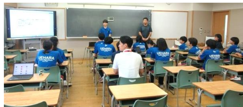
前期最後の専門委員会の様子（9月10日）