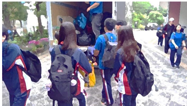
荷物の積み込み。忘れ物がないかな？