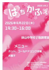
今年度第1回は4/22(水)開催 申込みは Home&School から!