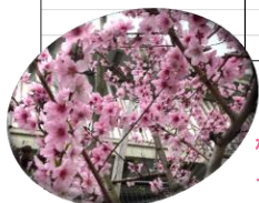
植込みのモモ。今年は見事な咲きぶりです。

環境が変わって、気を張って過ごした数週間。まもなく連休です。肩の力を抜いて過ごしましょう。安全にはくれぐれも気を付けてね。