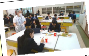
定期考査前リラックスして勉強してみるのもいいね。

そんな思いをもって、「はちかふえサロン」運営メンバーの皆様が毎月1回の居場所づくりをしていただいています。