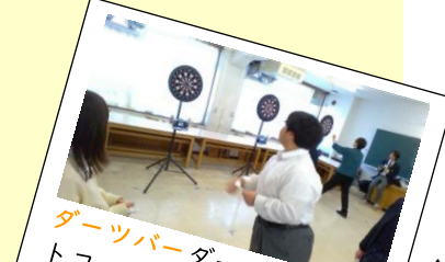
ダーツバーダーツとジェットコークを設置して生徒会とコラボの先生との交流会。