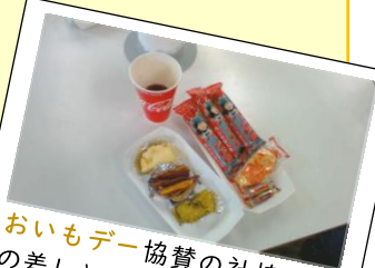
おいもデー協賛の社協からの差し入れ。スタッフの方が午前中から準備し、いも3種