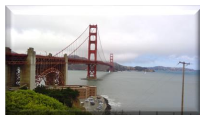
<ゴールデンゲートブリッジ>

渋谷から世界へ。Be a Challenger. 私もだいたいインスパイアされたシリコンバレーとなった。