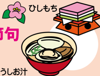
はまぐりのうしお汁