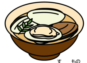
はまぐりのお吸い物

3月3日は「ひな祭り」。女の子の健やかな成長を願ってお祝いをする日本の伝統行事です。現在のように、ひな人形を飾るようになったのは江戸時代のことです。もとは人形を身代わりにして邪気をはらう「流しびな」が起源とされます。行事食として、ちらしずし、はまぐりのお吸い物、ひしもち、ひなあられなど、華やかな食べ物があります。