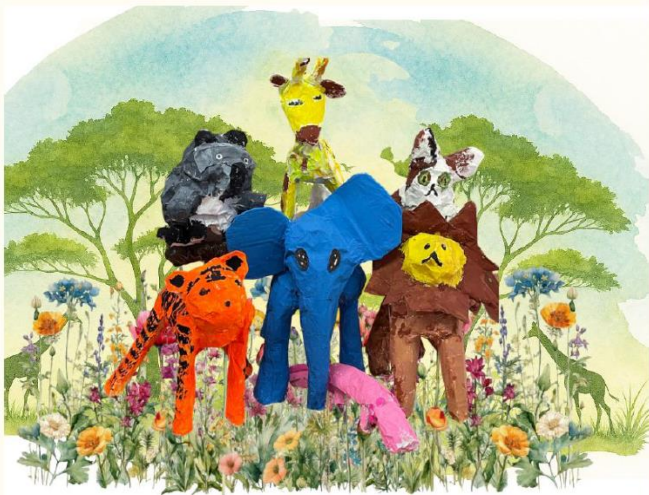
広尾小学校 児童の作品