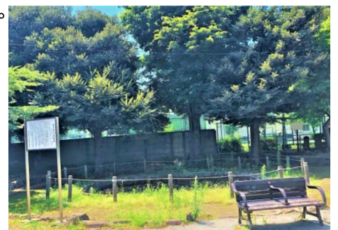
猿楽古代住居跡公園