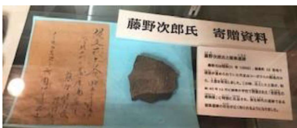
猿楽資料室に展示されている「寄贈された土器」

猿楽資料室には小学校と地域や金山小学校との交流そして古代遺跡の土器まで、思い出や歴史がたくさんつまっていて、これからも増え続けていくことでしょう。