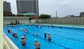
屋上プール（奥に見えるのがガーデンプレイス）

3階建ての校舎の屋上に25mプールがあります。ガーデンプレイスが望める展望は大変素晴らしく、夏休み中のプール開放はちょっとした人気なのですが、高い位置にあるため風が強く寒いと、児童の評判は今一つ？のようです。災害時には、水を供給する設備も設けられています。