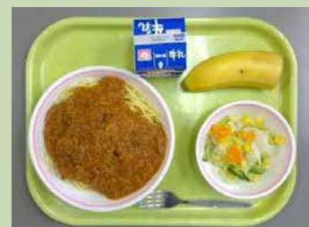
給食の王道 スパゲティーミートソース （すいません、給食室の写真がありませんでした・・・）

加計塚小学校の給食は、校内にある給食室で作られています。コロナ禍の影響で、毎年行っていた試食会が実施されていないため、筆者自ら頂いたことはないのですが、「加計塚の給食はおいしい」ともっぴらの評判です。給食室のみなさま、毎日ありがとうございます。