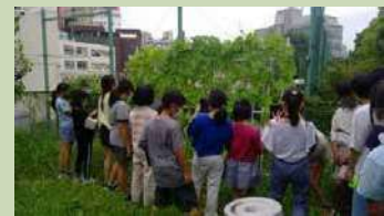
かけづかファーム

敷地の一角に、授業等に活用される農園が設けられています。地域コーディネーターさんの協力で、令和3年にリニューアルされました。これまで、ジャガイモやキャベツ等を育て、理科の授業に利用されています。今年の夏にはヘチマを育て、その育成を観察しています。加計塚はデジタル教育が進んでいますが、自然体験もバッチリです。また、コンポストを設置し、給食の残渣を堆肥化する実証実験を行っています。