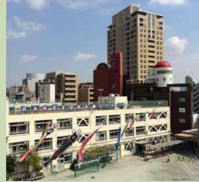
毎年掲げる鯉のぼりと校舎