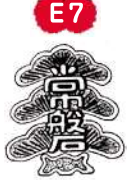
常磐松小学校 1925年創立