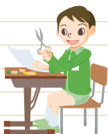
授業中にはさみで指を切る