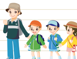
遠足で虫に刺される