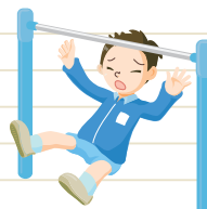
休憩時間に鉄棒から落下