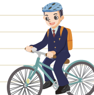
通学中に自転車で転倒