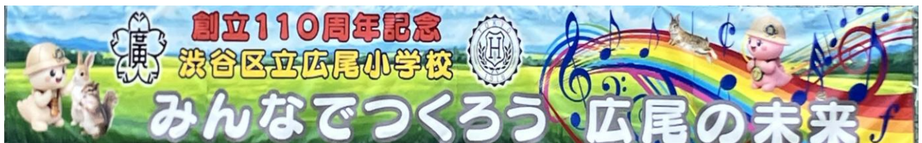
★横断幕が完成しました。広尾小キャラクター「ひろごん」(左)と「さくらごん」(右)もいます!

その見晴らしのよさに驚きの声もあがりました。今年度は保護者・地域の皆様にも上っていただく機会をもちたいと思います。ぜひ110年の歴史の重みを一緒に感じてください。