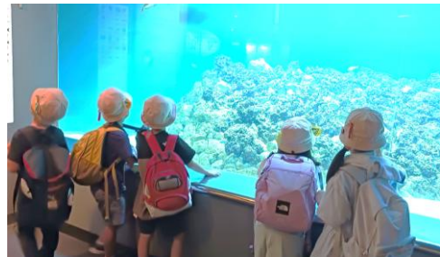
9月校外学習(葛西臨海水族園)での写真

もし、公園などでどんぐりや木の実を見つける機会がありましたら、ぜひ学校までお持ちいただけると助かります。ご協力、どうぞよろしくお願いいたします。