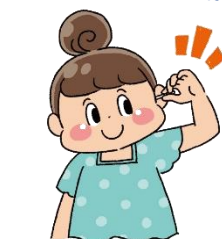
みみ み 耳 み そうじ み をする