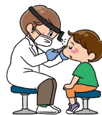
ち り ょう う ち ゅう び ょう き な 治療 を 中の を 病 を 氣 を を を 治 を してお く く