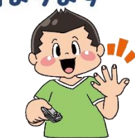
つめ き を切 き っておく