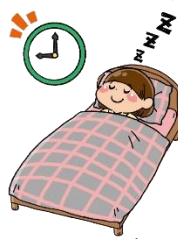
た ね っぷり ね 寝 る る