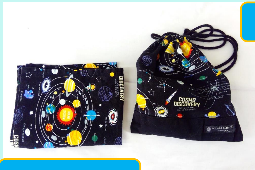
ランチョンマット

食事の時に机に敷きます。毎日、きれいなものを使用します。机の大きさは、縦40センチ、横60センチです。袋は小さいもので大丈夫です。