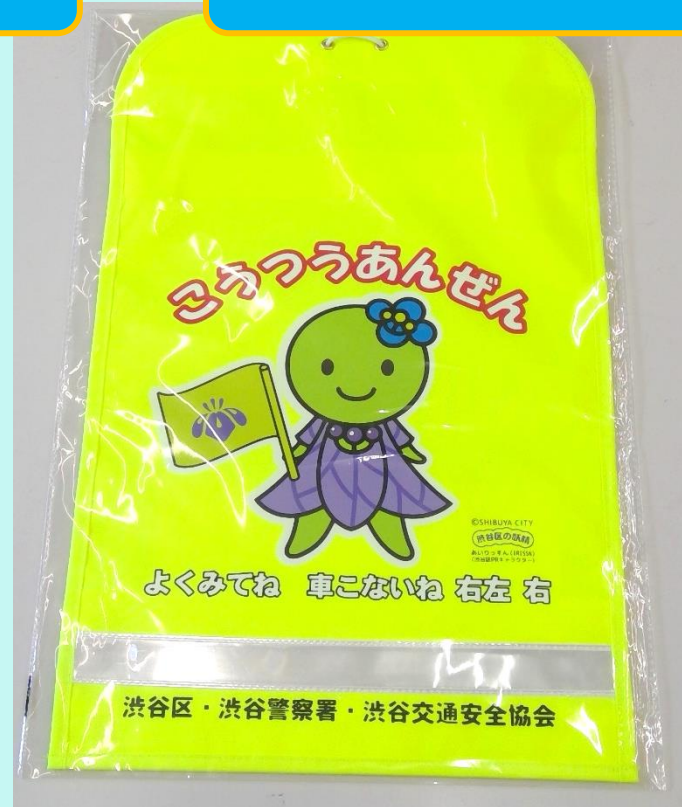
○ランドセルカバー